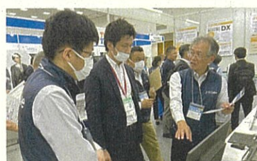
※上記写真は 2024 年 5 月に福岡で開催した「第2回 地域 × Tech 九州」の様子。