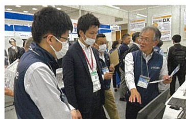
※上記写真は 2024 年 5 月に福岡で開催した「第2回 地域 × Tech 九州」の様子。