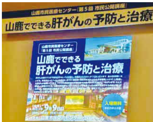
9月9日市民交流センターでの市民公開講座