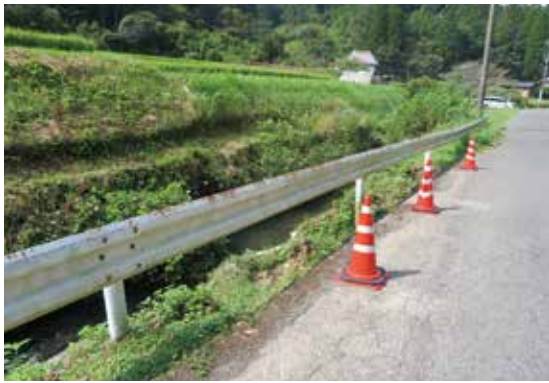
市道 鹿北町麻生市木線

令和5年6月から7月にかけての梅雨前線豪雨により被災した市道麻生市木線と下組地区農道の視察を行いました。執行部より、本年秋以降の発注を目指すとの答弁がありました。