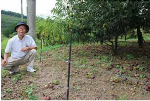
イノシシの侵入防止の電気柵 (鹿北町)