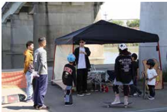
山鹿スケートボード協会 FLYID が主催するスケートボードスクールの風景