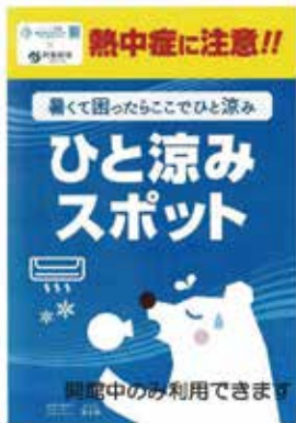
避暑施設「クーリングシェルター」阿賀野市のポスター