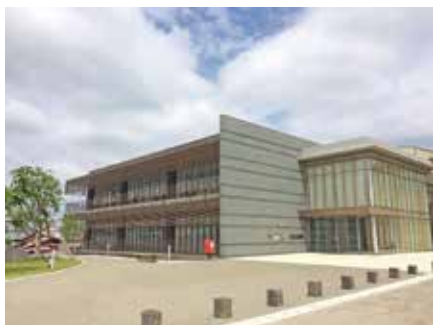
市民交流センター