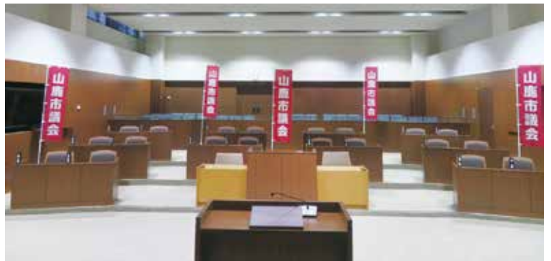
議会活動に活用するためののぼりを作成しました。