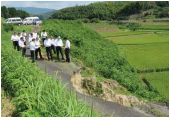
農道 菊鹿町下組地区