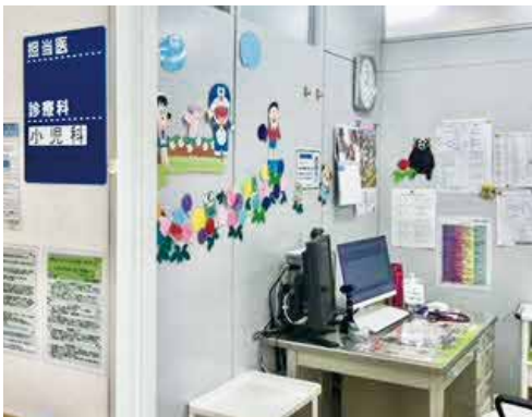
市民医療センター小児科診察室

市民医療センターでは、コロナ診療はもとより「がん診療」、「高齢者医療」、「予防医療」を3本の柱として、中核的医療機関の役割を果たしていきます。市の修学資金制度を利用した小児科医師が来年4月に着任予定です。市民公開講座などで医療や健康の情報発信にも取り組みます。