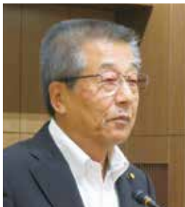
きたはら しょうぞう 北原 昭三 議員 (公明党)