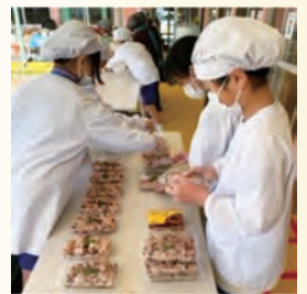
感謝を込めて赤飯作り

に挑戦し、6年生に感謝の気持ちを伝えました。この他にも、日輪寺での歴史学習や「こども認知症サポーター養成講座」、「やまがART2022」への黒板アート出品、老人会の皆さんとの昔遊びやグラウンドゴルフ大会、ビブリオバトル、シチズン教育、おにぎりマイスターデーの取り組み、育てた花鉢を地域の皆さんに届けるあったかハートの取り組みなどさまざまな体験活動を通して、創意工夫する楽しさや人とつながる喜びを感じてきた八幡っ子です。