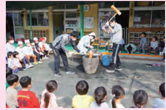
保護者と一緒の餅つき。子どもたちは作業の大変さと食べ物への感謝を学びます

積極的に関わったことで、子どもたちとたくさんの楽しい思い出もできました。これからも関わることを大切にして成長を見守っていきます。