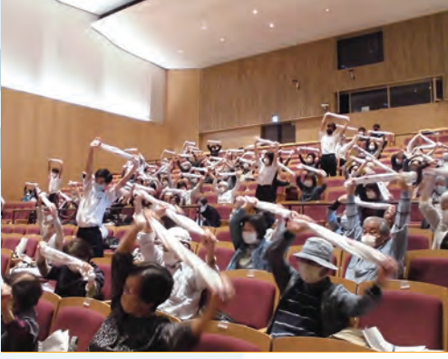
昨年度の生涯学習講座の様子

市民が心の豊かさや生きがいを感じ、充実した人生を送れるよう「生涯大学」「生涯学習講座」「自主講座」を開設します。身近で気軽に学べる機会を提供することで、市民の学習意識を高め、社会参画や社会貢献活動につなげるための実践的な学びを支援します。