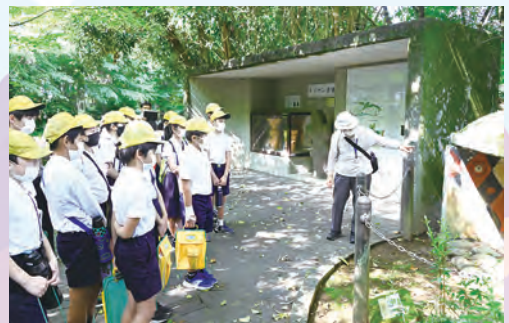
昨年度の古代史巡回バスの様子