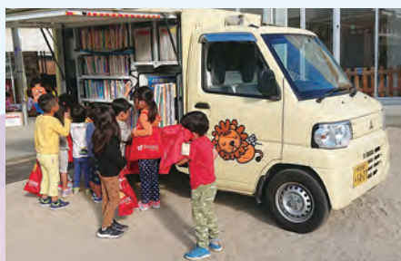
移動図書館車「おれんじ号」

「地域の子どもは地域で育む」の理念の下、地域住民の皆さんや学校、その他関係機関と連絡を密にし