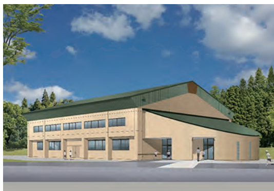
屋内運動場イメージ図

子どもたちの安全・安心な学校生活のため、老朽化している八幡小学校の屋内運動場を解体し、新設します。令和6年度の完成予定で工事を進めています。