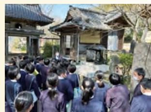
日輪寺で歴史を学ぶ

これからも、地域の皆さんとの関わりを一層深め、ふるさとを愛し、夢の実現に向け考動する八幡っ子を目指していきます。