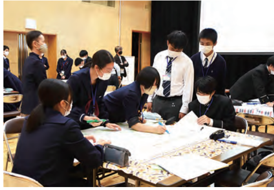
山鹿創生塾でのワークショップ

す。参加者で意見を交換しながら作品作りに取り組みワークショップなどを実施します。