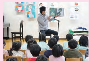
お父さんによる読み聞かせ会

積極的に関わったことで、子どもたちとたくさんの楽しい思い出もできました。これからも関わることを大切にして成長を見守っていきます。