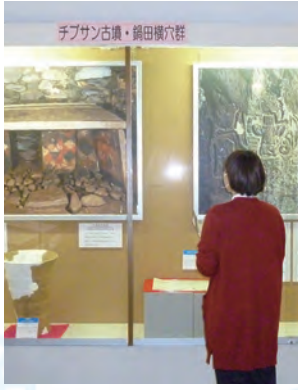
山鹿市立博物館企画展

歴史資料などについての調査・研究を進め、その成果を生かした企画展示を実施します。令和5年度は昭和の暮らし展、地域の文化財や肥後琵琶に関する展示、山鹿の石橋パネル展を開催する予定です。また、老朽化した施設整備についての検討を引き続き進めます。