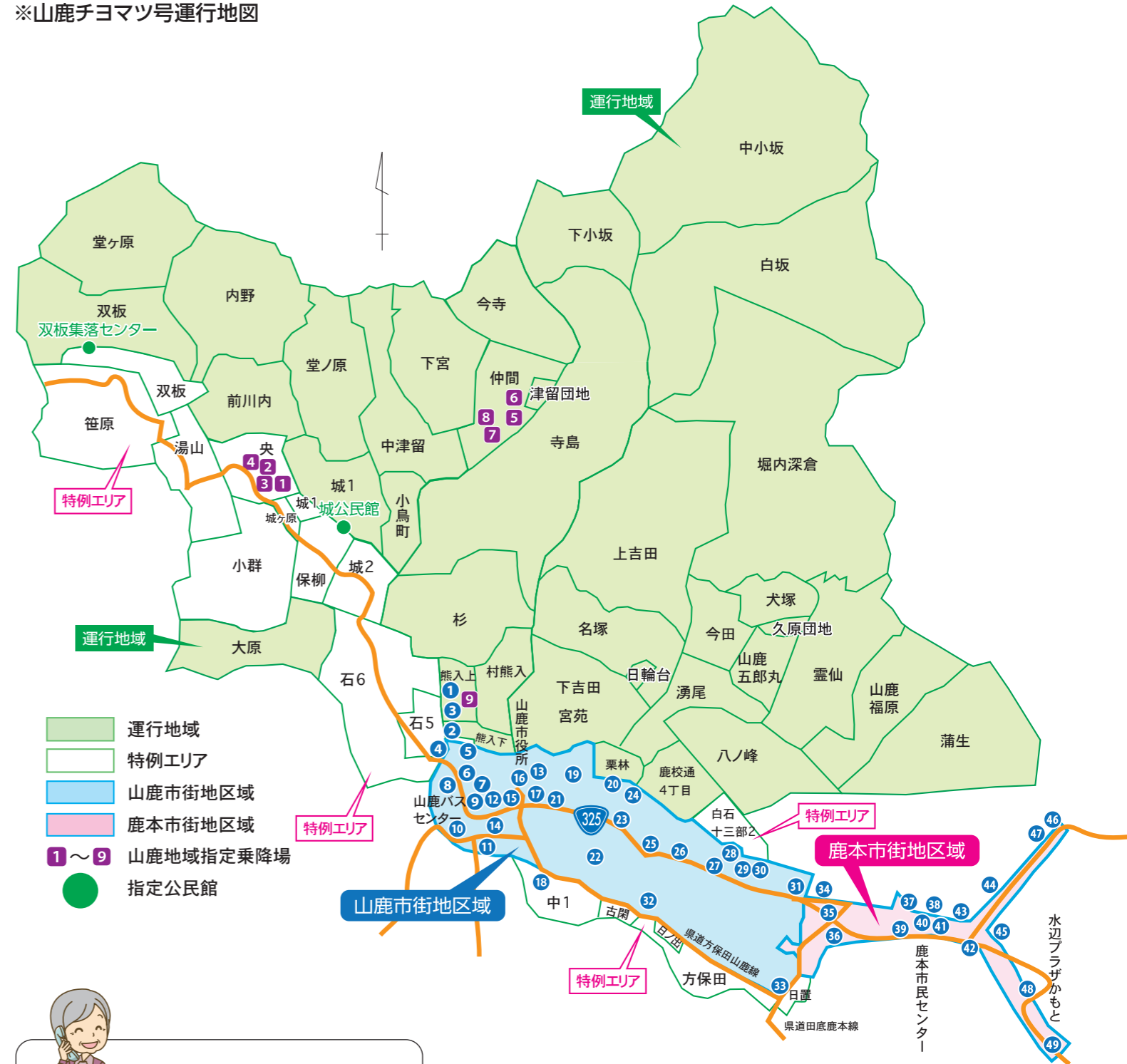
※山鹿チヨマツ号運行地図