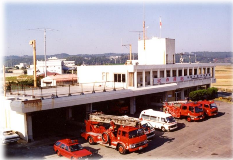
旧山鹿植木広域行政事務組合消防本部(～平成19年7月)