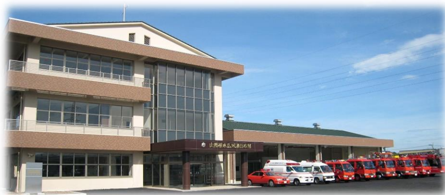
山鹿植木広域行政事務組合消防本部(平成19年8月～平成27年3月) 山鹿市消防本部(平成27年4月～)