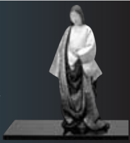
林駒夫 青衣女人(平成13年)

期間▷12月23日(祝)まで 会場▷熊本県立装飾古墳館 入館料▷一般：410円 大学生：250円 幼児・小・中・高生：無料 問合せ▷熊本県立装飾古墳館 ☎36-2151