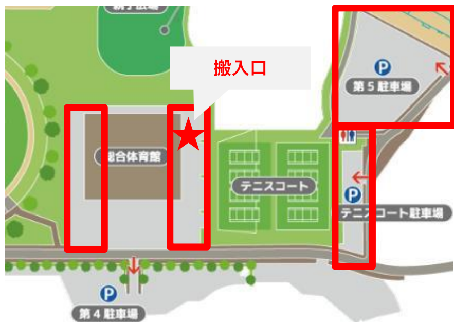
○参加企業の駐車場

総合体育館の両サイドの駐車場は、1社につき1台まで駐車可として、2台目以降は、第5駐車場もしくはテニスコート駐車場に駐車を依頼した。展示品などの搬入のために搬入口近くに一時停止することは可能とし、搬入後は車を必ずご移動いただくように依頼した。