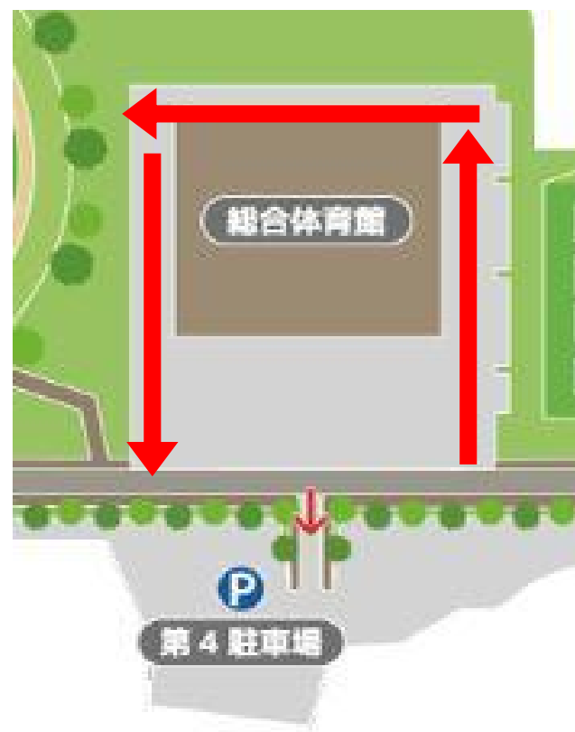
○総合体育館周辺の進行方向について

総合体育館の両サイドの駐車場は、1社につき1台まで駐車可として、2台目以降は、第5駐車場もしくはテニスコート駐車場に駐車を依頼した。展示品などの搬入のために搬入口近くに一時停止することは可能とし、搬入後は車を必ずご移動いただくように依頼した。