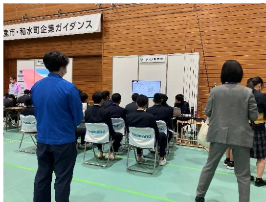
↑シマノ熊本(株) ↓山鹿市消防本部