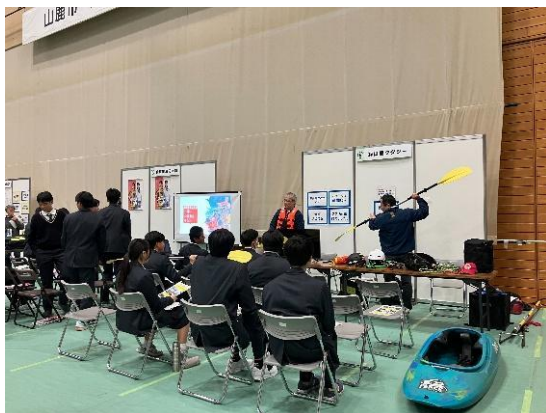
↑(有)山鹿タクシー ↓(株)清流荘

生徒自身が『見て』、『触れて』、『理解を深める』ための体験・展示ブースを設置した。参加企業の体験内容については、事務局から支援を行った。(写真は一部)