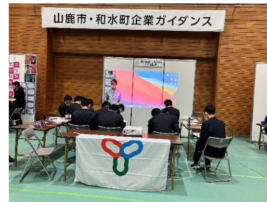
↑(株)あつまるホールディングス ↓(株)ラ・モード