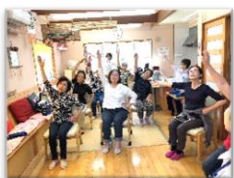
体操をしている様子