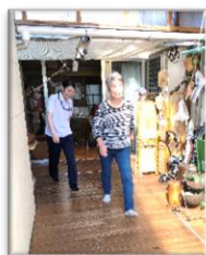
評価をしている様子