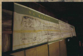
宝暦新町絵図 江戸時代の宝暦13年(1763)藩主細川賢公の特命を受け招いた絵師により作成した山鹿郡新町(鹿本町来民)の絵図。213年前の家屋や営業の様相など来民の繁栄を知る貴重な絵巻。 ◀レプリカ(卑弥呼齋院)