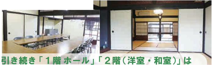
引き続き「1階ホール」「2階（洋室・和室）」は貸し出しできます（要予約/鹿本市民センター受け付け）