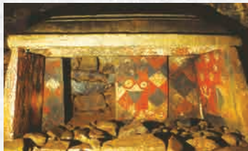
チブサン古墳石屋形

装飾は玄室の奥壁に置かれた石屋形に描かれています。まず目を引くのが、正面に描かれた装飾です。壁面いっぱい三角形を組み合わせて描き、その上に同心円を二つ並べています。この二つの円文が女性の乳房に見えることから、お乳の神様として信仰され、名前の由来になったといわれています。図形は赤、白、黒