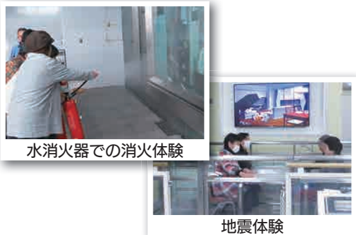
▲昨年度の視察の様子

※「団体」とは、男女で構成され、男女それぞれが役割を持ち、能力を發揮して活動している団体も含まれます。