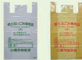
燃えないごみ 燃やすごみ