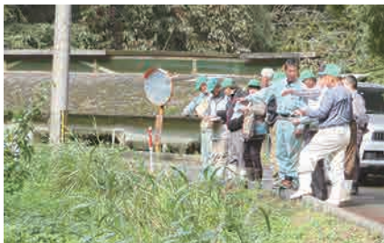
昨年度の農地パトロールの様子

調査の結果、遊休農地と判断された場合は、農地の所有者に対し、遊休農地を今後どのようにしたいのか「利用意向調査」を行い、その結果を基に、農業委員会によるあっせんや農地中間管理機構を通じた担い手への貸し借りの仲介などを行います。