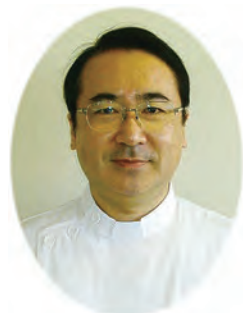
副院長兼地域医療部長 (整形外科)