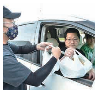
ドライブスルー形式で商品を受け取る利用者

新型コロナウイルスの影響で売り上げが減少した市内の飲食店が連携して、商品をドライブスルー形式で販売する取り組みが山鹿市役所駐車場で行われました。これは感染リスクを抑えつつ、家庭で飲食店の料理を楽しんでもらおうと山鹿市飲食店組合が実施したもので、会場には連日多くの利用者が訪れました。