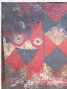
石屋形正面の装飾

造られて1500年以上経過しているにも関わらず、当時から風化しない非常に鮮やかな色彩が今も昔も人々を引き付ける、魅力のある古墳です。