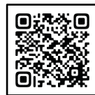
家庭ごみ 分別辞典