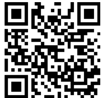
【予約用二次元コード】