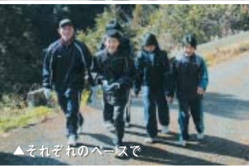
▲それぞれのペースで