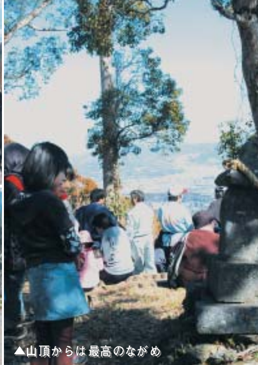
▲山頂からは最高のながめ