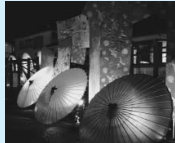
▲カラーでお見せできないのが残念です

また、キャンペーン初日の夜には、灯笼娘が登場し、訪れた観光客は盛んにカメラを向けていました。