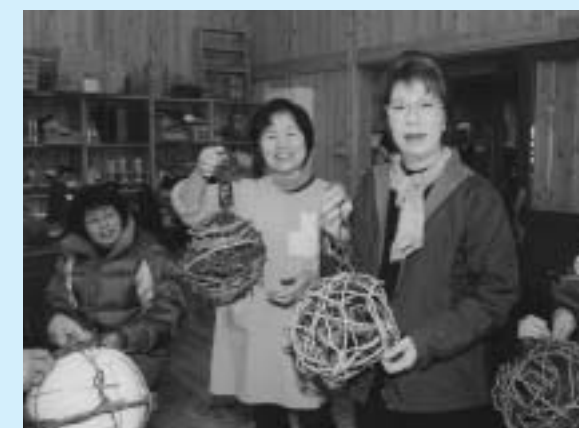
▲ちょっと難しかったけれど、お気に入りことができました

はじめはかずらの固さに四苦八苦していたものの、次第にコツをつかみ、思い思いに自分だけの作品が完成。参加者からは「難しかあ。でもこれが世界に一つだけの作品と思うとがんばれますね」「編んだことはあるけど、基礎を勉強したくて参加してみました」などの感想が聞かれ好評でした。