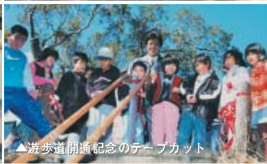
▲遊歩道開通記念のテープカット