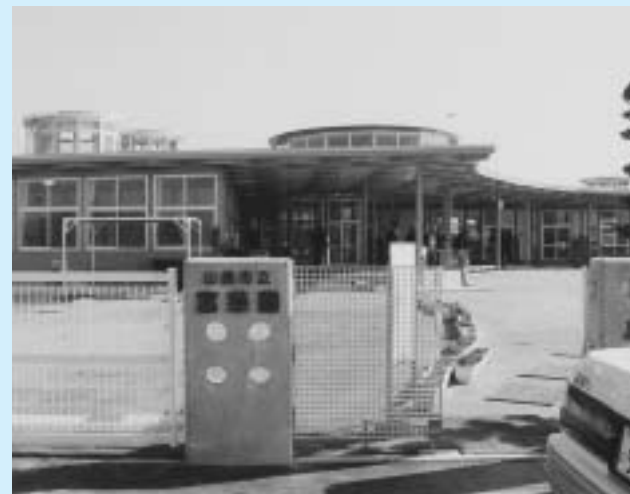
▲太陽の光が降り注ぐ天窓と広いデッキテラスが自慢です