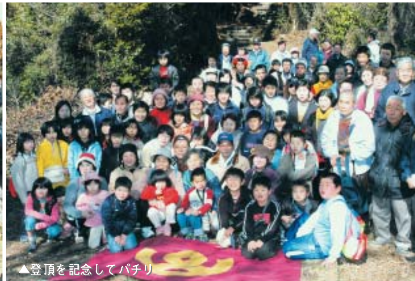
▲登頂を記念してパチリ