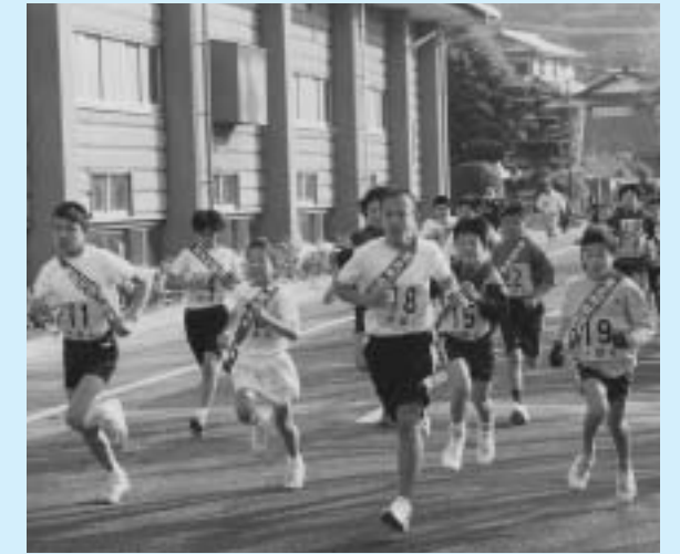
▲少しでも早くタスキを渡すため、全力で走ります

優勝：下中チーム、準優勝：東野チーム、第3位：陣内チーム、第4位：幸ヶ丘Aチーム、第5位：荒平Aチーム