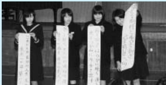
▲▼決意を発表する生徒たち 鶴城中(上)と菊鹿中(下)