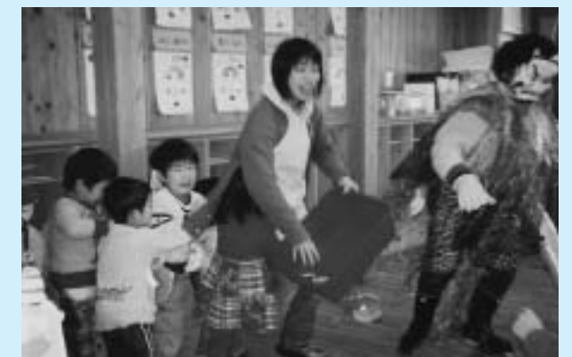
▲こ、こわい…。でも、豆を投げて追い払わなくちゃ（泣

また、この行事には一時保育を利用して訪れた子どもたちも参加して、みんなで楽しい豆まきができました。