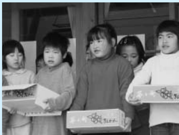
▲あまくておいしいきんかんをありがとうございました！