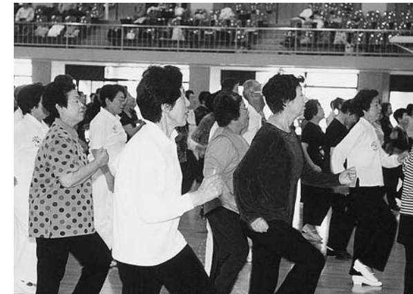
ワン・ツー・ワン・ツー！元気な声が響きます。