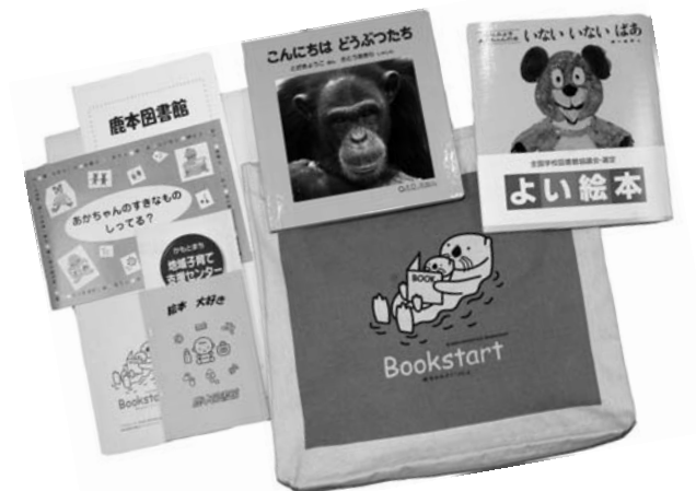
ブックスタートパック

最初のうちは、本をかじったり、放り投げたり、ただめくだけでも構いません。それでもかまわないのです。絵を見ながらたくさん話しかけてあげることが、赤ちゃんにとって、とても大切なのです。