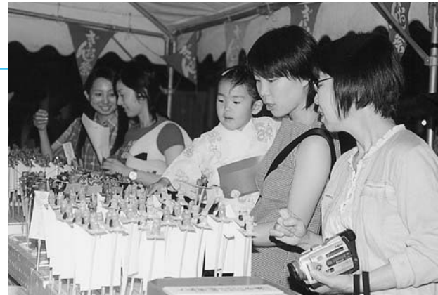
いろいろあるね、どれがいいかな？

祭の日は「初かたばら」ともいい、この日から浴衣を着始める習慣があり浴衣姿の子どもや女性が多く見受けられました。また、境内では山鹿市明るい選挙推進協議会が選挙啓発のチラシやグッズを配り「明るい選挙」を呼びかけました。