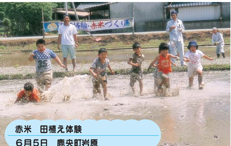
赤米 田植え体験 6月5日 鹿央町岩原