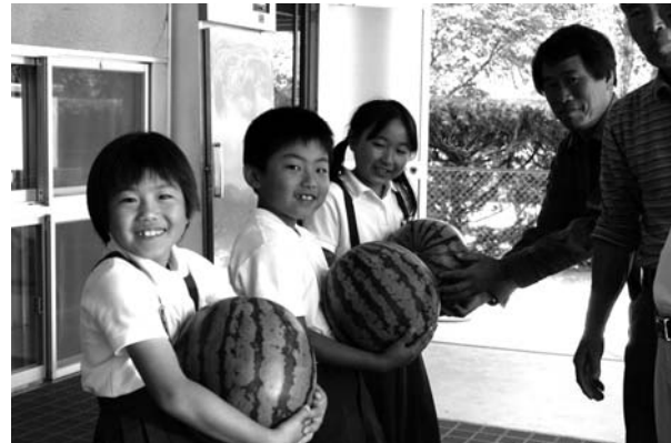
ずっしりと大きなスイカ。何人分あるかな？