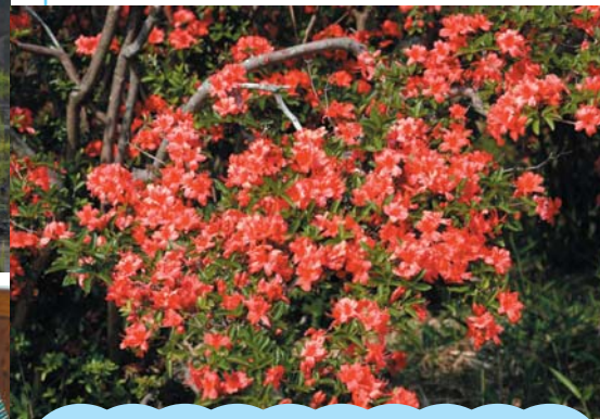
ツツジ 隈部館跡 (菊鹿)

いまから約500年前、この地域を治めていた隈部氏の持ち城があった隈部館跡。ここでは春に桜が、そして5月から6月にかけてはツツジが鮮やかな花を咲かせます。