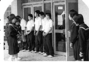
朝のあいさつ運動

あいさつ運動 本校はあいさつ運動推進校の指定を受けて3年目を迎えます。しかし、生徒会執行部や各委員はその前からあいさつ運動に取り組んでいて、伝統になっています。ここ数年は、学校の中だけでなく地域でも自然に大きな声であいさつをできるようになってきました。