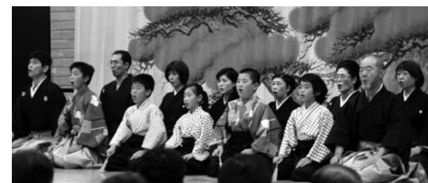
山鹿市の門出を祝して。小謡「鶴亀の舞」