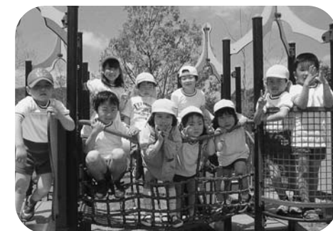
あんずの丘に行っ、ハイ、ポーズ!

「人が輝き、自然が輝き、町が輝く」のスローガンのもと、育まれてきた菊鹿の子どもたち。その中心にある菊鹿中央保育園です。 現在、36名の園児たちが元気に登園しています。田舎町の小さな保育園ならではの、子どもたちが日々安心して過ごせるよう家庭的な雰囲気の中で保育に取り組み、健康で明るく思いやりを持った豊かな心を自然の中でびびと育んでいます。 四季折々の自然と触れ合ったり散歩コースには「あんずの丘」もすぐそこです。毎年行われる「菊鹿夏祭り」では、この大きなステージで伝承踊りの「牟弥呼の舞」などを披露し地域の方々にも喜んでもらっています。 その他、地域の行事に積極的に参加させていただき、ふるさとを大切に思う心を育てていきたいと願っています。泣いたり笑ったり...子どもたちの健やかな成長を見守る喜びを保護者の皆さまと一緒に噛みしめながら、ともに生き、ともに育つ保育を目指しています。