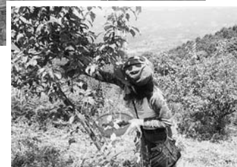
景色はパツゲン！ 大きい梅はどれかな？