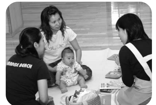
赤ちゃんは、内容はわからなくても興味津々!?