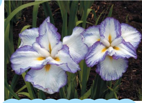
花しょうぶ 菖蒲園 (道の駅かほく小栗郷)

道の駅かほく小栗郷の裏手にある菖蒲園では、6月下旬から7月にかけて、大輪で豪華な花を咲かせる肥後系の熊本花菖蒲約15,000株が咲き誇ります。また、この時期道の駅でも「花しょうぶまつり」が開かれます。