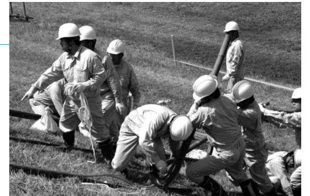
つないだ竹を杭に縛り付け、竹の弾力性で亀裂の拡大を防ぐ「繋ぎ縫い工法」を施す国土交通省職員

また、演習後には「防災ボランティア山鹿あいの会」による炊き出しがあり、団員たちの労をねぎらいました。