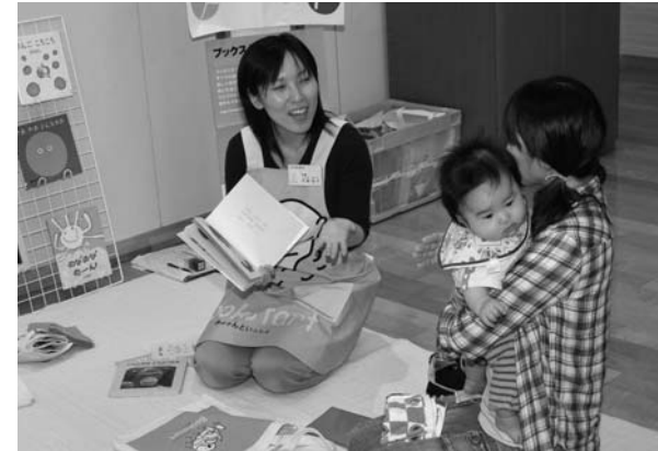
きっかけは乳児健診で

肌の温もりを感じながらことばと心を通わす...、ブックスタートは、そのかけがえのないひとときを「絵本」を通じて過ごせるように応援する運動で、読書の推進だけでなく子育てを応援する運動でもあります。