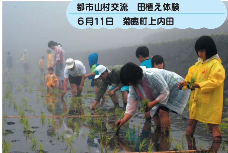
都市山村交流 田植え体験 6月11日 菊鹿町上内田