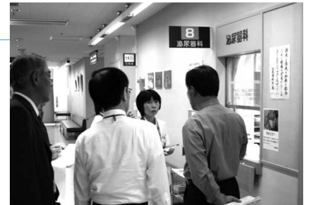
各病棟が細部にわたりチェックされました

市立病院では、今回の審査結果をもとに改善を重ね認定証の取得を目指すとともに、医療の質の向上と効果的なサービスの提供に向けて一層の努力を続けます。