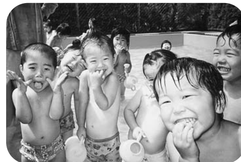
水遊び、楽しいね!お顔が笑顔になるよ!

「大きな声であいさつをする」「進んで片づけをする」「お集まりの時のお話をしっかり聞く」「脱いだ靴はきちんとそろえる」を毎日の生活目標に遊びを中心に据えながらもけじめのある毎日をと心がけています。 毎週ある体育教室では、心と体を鍛え、デイサービスの方との交流・地域の文化祭・ふれあいピックなどへの参加・動植物を育てる・異年齢との交流などをしています。障害を持つお子さんも一緒に過ごす中でお互いを必要とし、お互いを思いやれる心豊かな子どもに育ててほしい・保護者と園との共通した大きな願いです。 7月はプール開き・七夕会・お泊まり保育・そして夏祭り子どもたちの瞳も一段と輝きます。