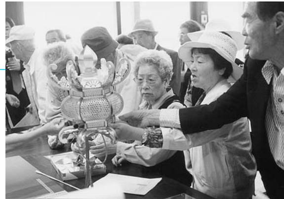
これが紙と糊だけでできるとね。軽か～

参加者からは「今まで入った温泉で一番いい温泉でした。お湯がいいですね」との感想が聞かれ、山鹿を満喫していました。