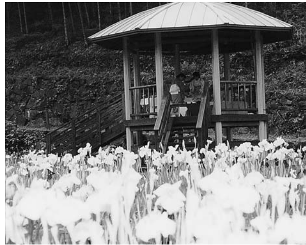
菖蒲の海といった雰囲気です