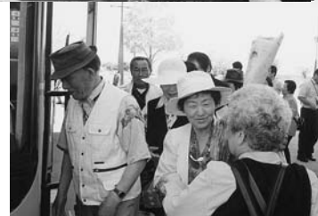
お別れの時。避難所は違っても、今度は玄海で会いましょう！