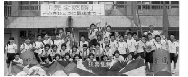
みんなの顔に達成感があります(解団式)

大運動会 5月21日、「完全燃焼」をテーマに開かれた大運動会。体育委員長や団長、生徒会執行部を中心に練習に取り組みました。当日はテーマのとおり完全燃焼して、勝ち負けに関係なくみんなでがんばりをたたえ合いました。一つの行事を終えることで、またひと回り成長できたように思います。