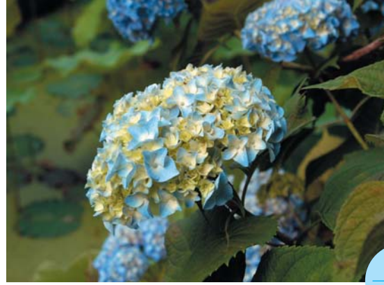
蓮とあじさい 古代ハス園 (鹿央)

6月、市内各地で田植え体験がありました。鹿央では古代のお米「赤米」の田植えに挑戦。泥こになりながらゲームも楽しみました。(写真左上下) また、菊鹿でも福岡、熊本などからの親子連れが棚田で田植えに挑戦。田植えの後は地元生活改善グループの指導で冷や飯団子の作り方を教わりました。(写真右上下)