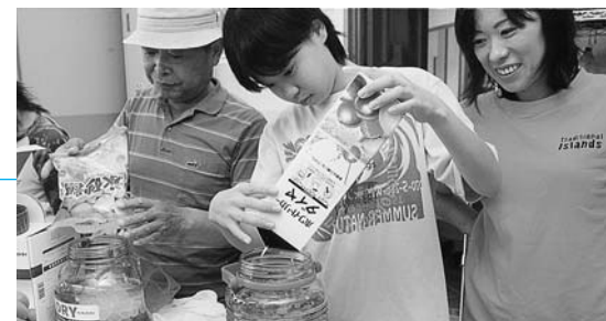
40日後には・・・でも私が飲めるのは20歳から！

そのうち平小城小学校では、同部会員が大きなスイカを手渡すと、生徒たちは「毎年ありがとうございます。みんなでおいしくいただきます」とお礼を述べていました。