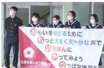
あいさつ運動の活性化