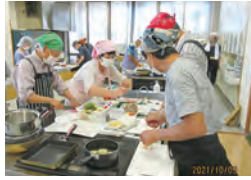
令和3年度の教室の様子