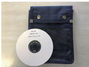
CDを郵送するための専用のバッグ

音声訳CDは、左記の専用バッグで郵送します。また、聴いた後は、バッグだけを郵送で返却してください。なお、郵送料は無料です。また、聴いた後のCDが不要な場合は、CDをバッグに入れて返送してください。