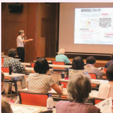
昨年度の生涯学習講座の様子

市民が心の豊かさや生きがいを感じ、充実した人生を送れるよう「生涯大学」「公民館講座生涯学習講座」「自主講座」を開設します。身近で気軽に学べる機会を提供することで、市民の学習意識を高め、社会参画や社会貢献活動につなげるための実践的な学びを支援します。