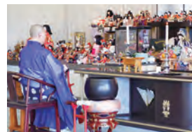
3月に開催した人形供養