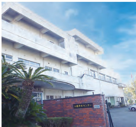
山鹿浄水センター

山鹿市および熊本市北区植木町のし尿および浄化槽汚泥などを広域処理している山鹿衛生処理センターが、老朽化に伴い令和6年度末で廃止予定のため、新たに山鹿浄水センターを活用し、処理を行うためのし尿等受入施設を建設します。