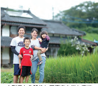
山形県から移住し豆腐店を営む家族

移住希望者に対する相談体制の充実と空き家のさらなる有効活用を図るため、空き家バンクの運営を民間団体へ委託するとともに、移住する人に対し、住まいや生活に係る補助制度を活用し、移住者の増加と定住に向けた取り組みを推進します。