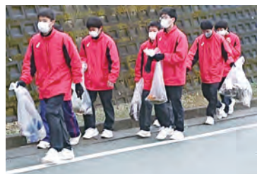
地域のゴミ拾いボランティア