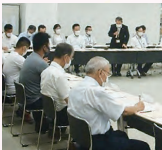
昨年度の統合準備委員会の様子

令和5年4月の統合に向け、保護者・地域・学校の代表者で構成された統合準備委員会を開催し、遠距離通学対策や学校間の児童交流など検討事項を協議していきます。