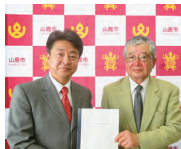
早田市長（左）と古江会長（右）