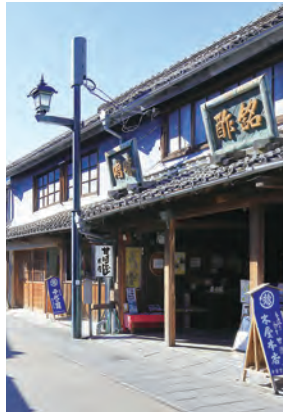
豊前街道のまちなみ

歴史的・文化的な価値を持つ豊前街道に点在する空き家、空き店舗などの利活用を引き続き支援することにより、新たなにぎわいの拠点を創出します。