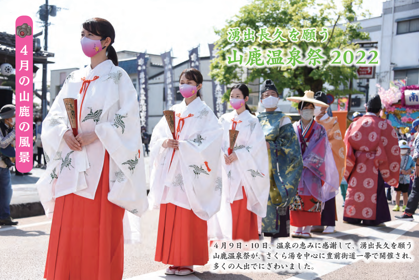
4月9日・10日、温泉の恵みに感謝して、湧出長久を願う山鹿温泉祭が、さくら湯を中心に豊前街道一帯で開催され、多くの人出でにぎわいました。