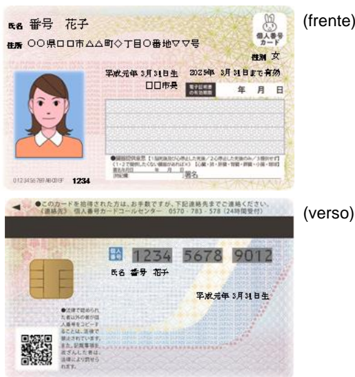
[Cartão com o Número Individual ( Kojin Bangō Card )]